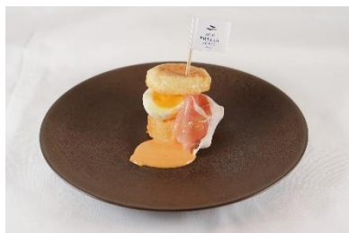
<エッグベネディクト>

北海道大学卒業卵を使用した生触感フレンチトーストを、同卵や北大牛乳などに12時間漬け込み、北大ミルクアイスクリームをのせ、上から塩キャラメルソースをかけることで濃厚な味わいとフワフワの触感を楽しめる一品