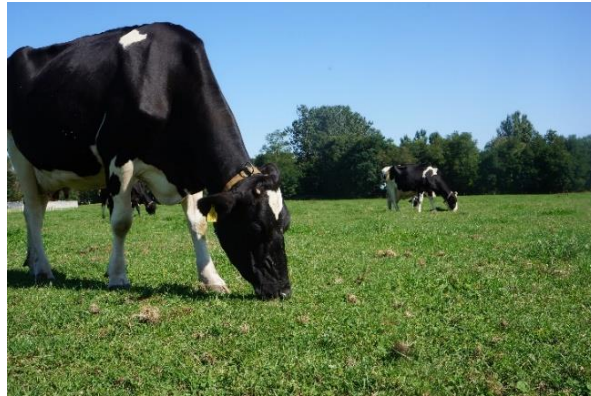
＜北海道大学北方生物圏フィールド科学センター 生物生産研究農場＞

1876年、札幌農学校の開設と同時に設立された研究農場であり、学生実習や作物の栽培研究をはじめとする農学分野に関わる多彩な教育研究に活用されています。乳牛の研究は、1889年より開始し、現在では、その子孫も含む約40頭の牛が農場内で育てられ、多様な研究に利用されるとともに、市内中心に広がる放牧風景は、北大のシンボルとして親しまれています。