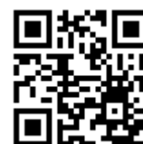
<動画二次元バーコード>