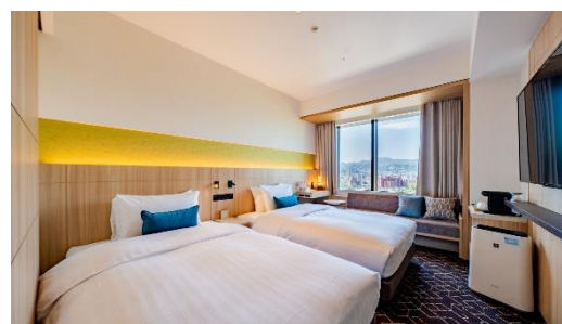
<客室 (コンフォートツイン) >