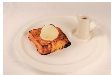
<フレンチトースト>