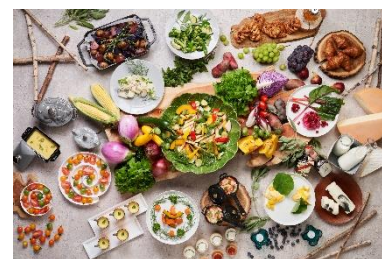
<朝食ブッフェイメージ>

(8) ホームページ https://www.keioprelia.co.jp/sapporo/breakfast/