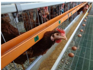
<北海道大学北方生物圏フィールド科学センター 生物生産研究農場>

当ホテルでは、徒歩1分の近さにある北海道大学と連携し、北大食材の発信拠点として、今後も商品開発に取り組むとともに、北海道食材の新たな一面に出会える朝食を提供していきます。