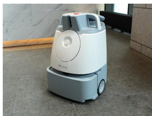
《AI 清掃ロボットの活用》